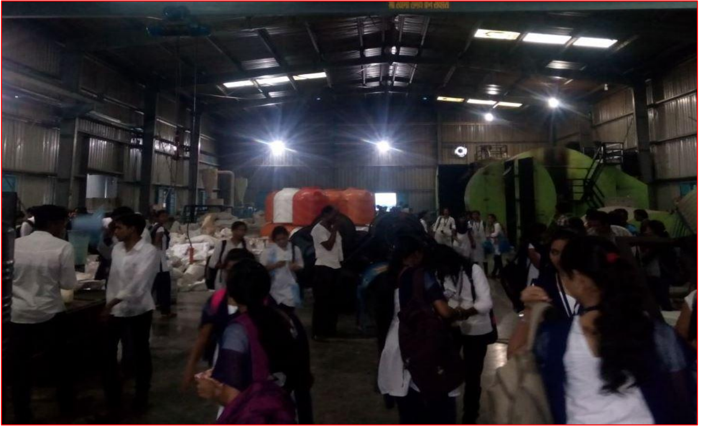
Industrial visit of Technical Entrepreneurship Development Programme (TEDP) Participants