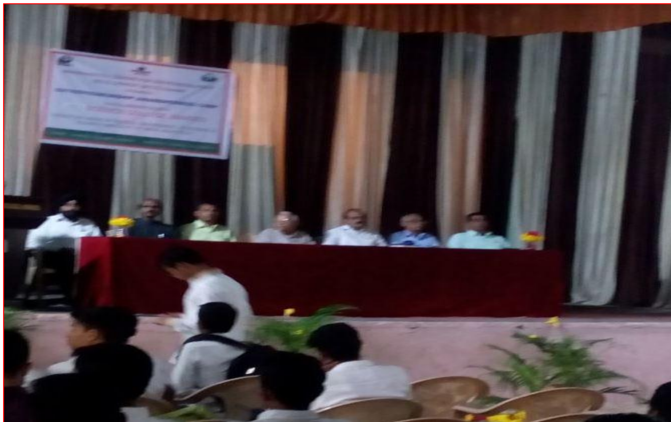
Inauguration of Technical Entrepreneurship Development Programme (TEDP)